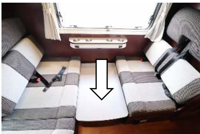
テーブルを座席の間に置きます