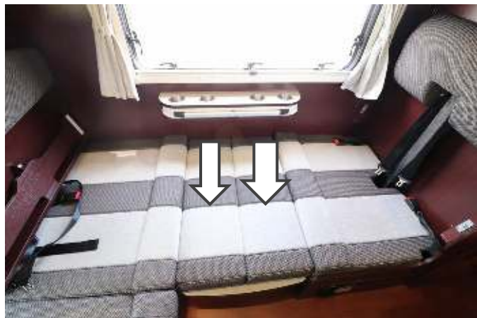
外した背もたれはテーブルの上に置きます。 これで1人分のベッドが完成しました。