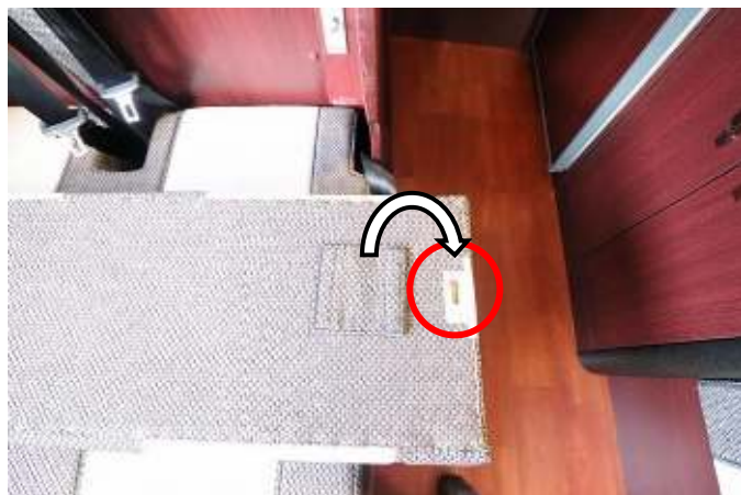
金具でテーブルを傷つけないように布で保護します