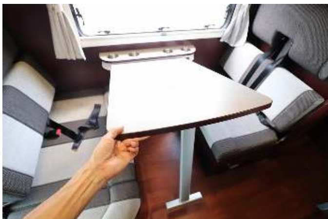
テーブルの端を持ち上げて外します