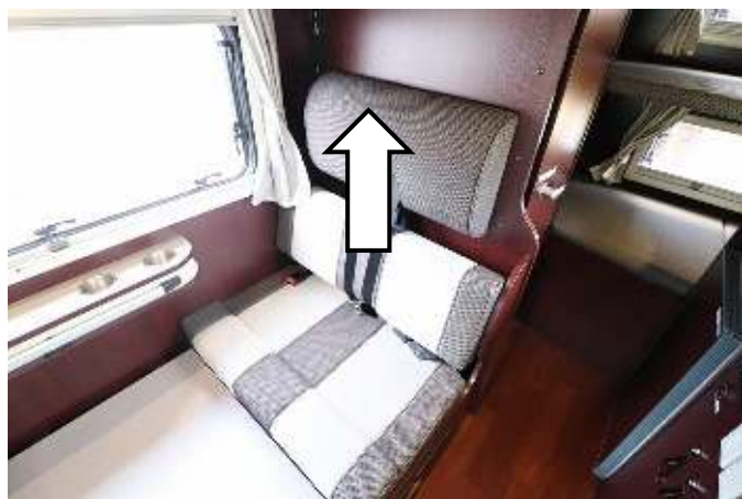
背もたれを少し上げて外します。