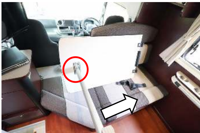
足の付根のボタンを押してロックを解除、足を折りたたみます。