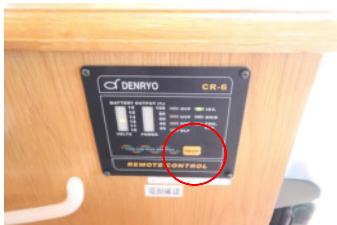
インバーターはサブバッテリーの12Vを100Vに変換する機器です。電子レンジ、炊飯器などは使用できません。使わないときはOFFにしてください。