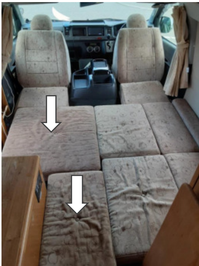
車内のマットを置いて2人分のベッド完成