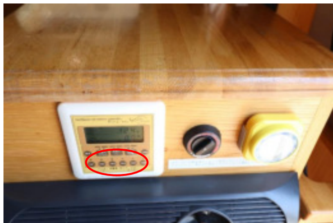
冷蔵庫、水道ポンプなどのスイッチ