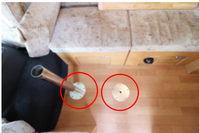
ポールを2本立てて、テーブルをセットします。 ポール、テーブルは後部ベッドの下にあります。