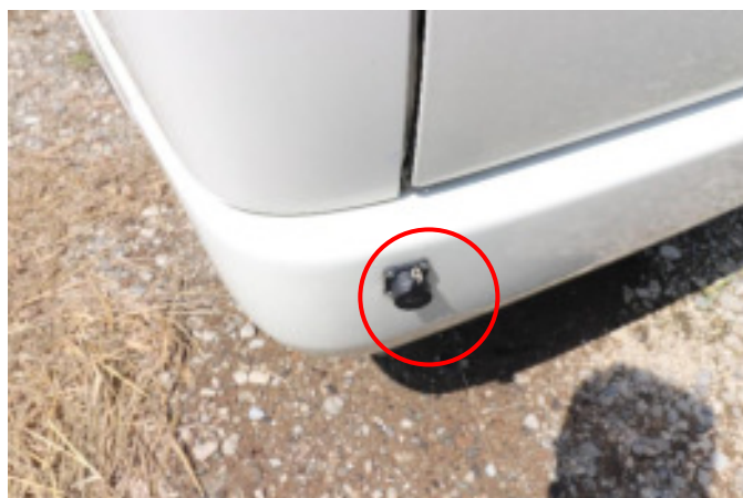
車内にあるコードを接続します。外部から電気を引けば車内のコンセントが使えます。