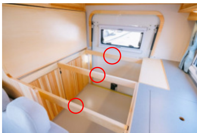
支えの棒をはずしてマットと一緒に収納します。