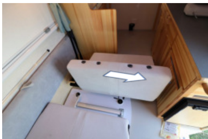
ベッドのままでは動かしにくいので座面を一度上げてから動かします。