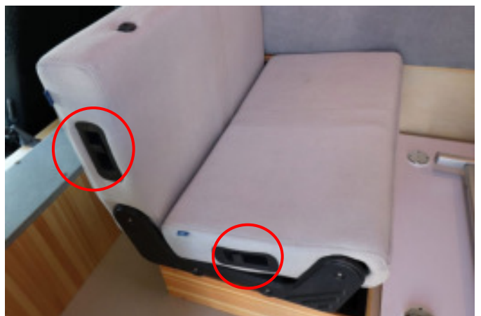
座席脇のロックを解除すると座面、背もたれが動きます。