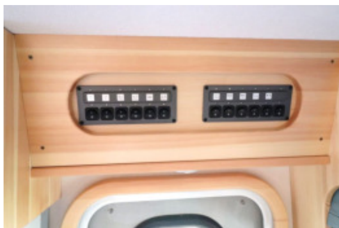
照明、冷蔵庫、水道ポンプなどのスイッチ