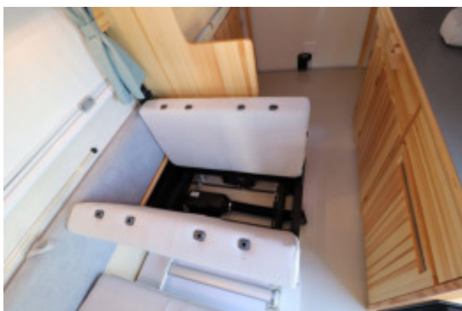
座面を反転して背もたれを前に倒します