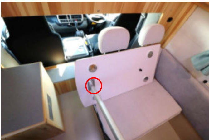
ボタンを押してロックを解除し、足を折りたたみます。