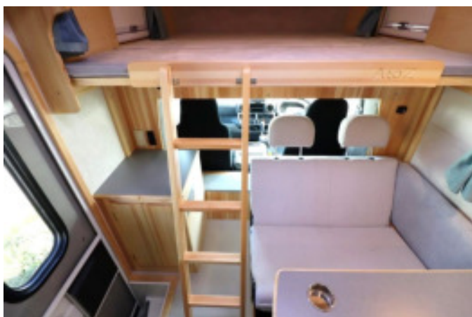
上り下りははしごをご利用ください