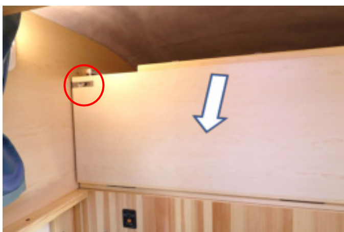
ロックを解除し板を開きます