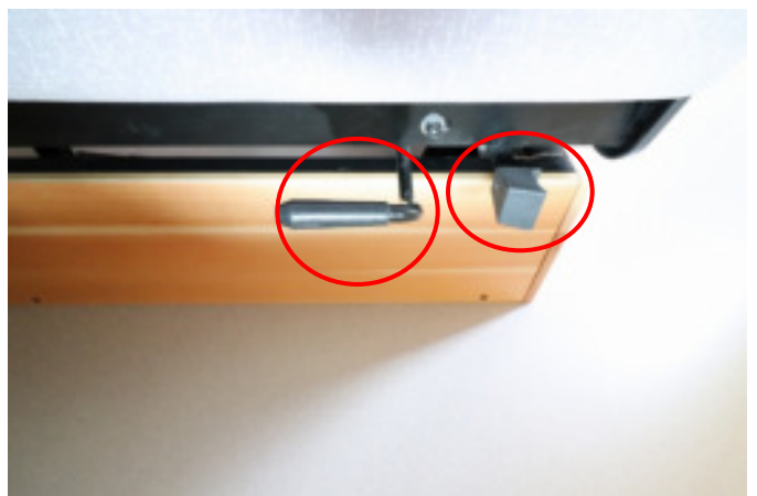
左が前後に動かすレバー。右が左右に動かすレバー