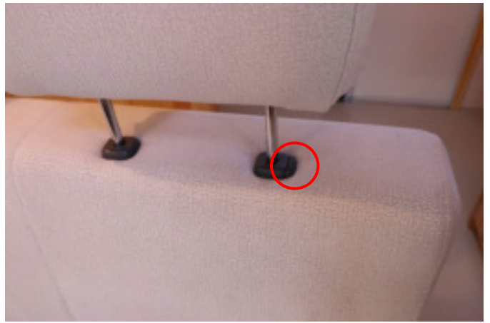
ロックを解除しヘッドレストを外します。