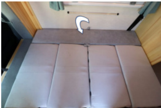
間にサイドマットを置いて2人分のベッド完成