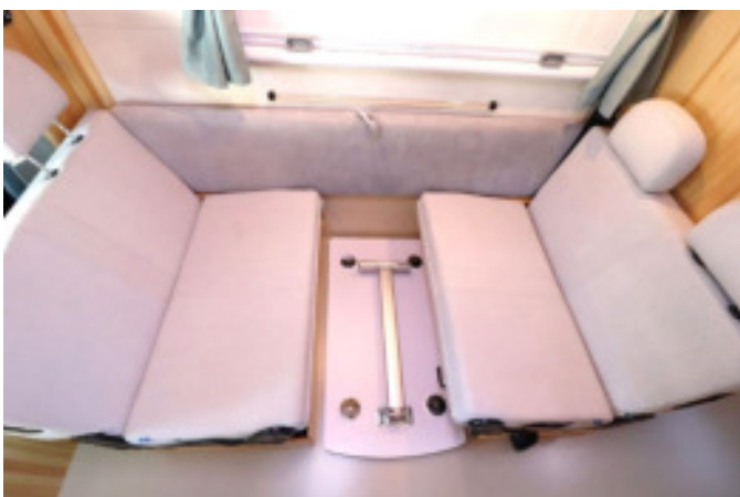
テーブルは座席の間に置けます。