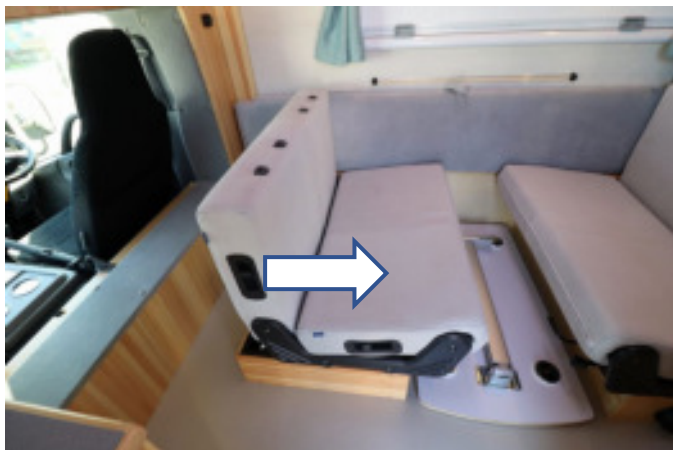
足元のレバーでロックを解除し後ろに動かします。