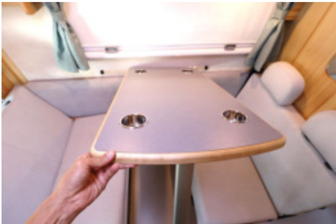
テーブルの手前を上げて外します