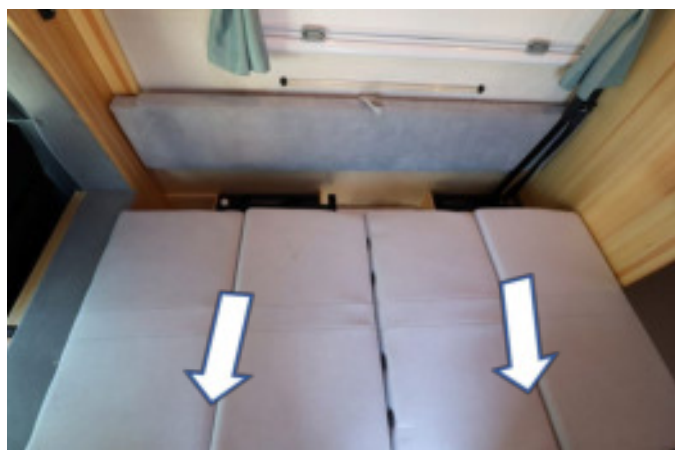
足元のロックを解除し通路側にスライドします。