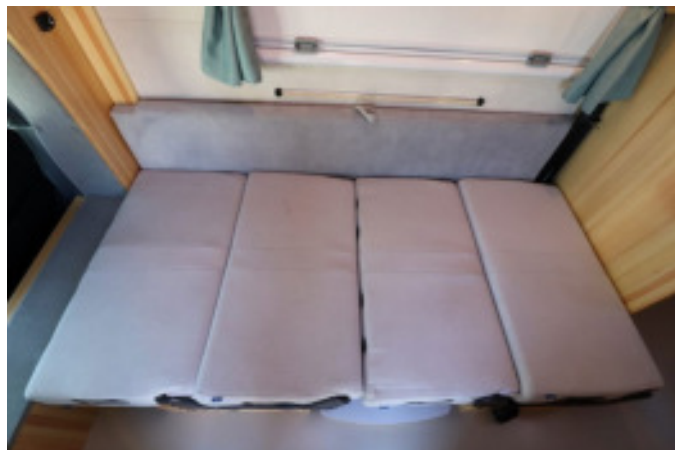
平にして1人分のベッドの完成。