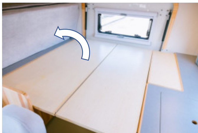
マットは折りたたんで図の位置に収めます。