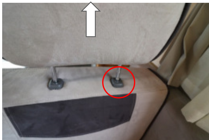
ヘッドレストの付け根にあるロックを解除してはずします