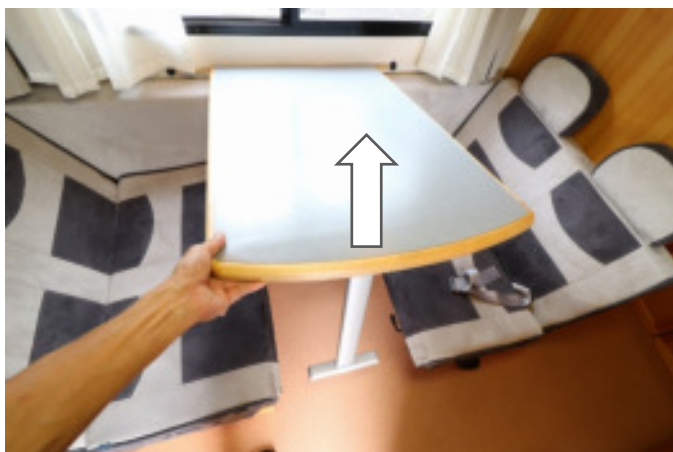
テーブルの端を上げて外します