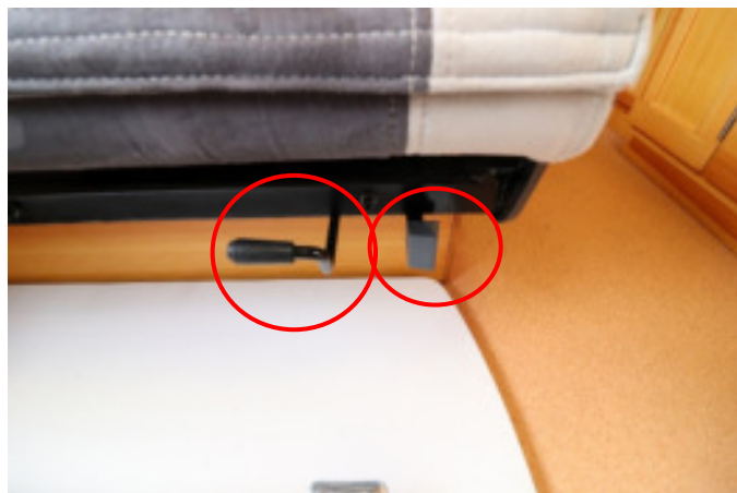
座席下の左のレバーで前後に、右のレバーで左右に動きます