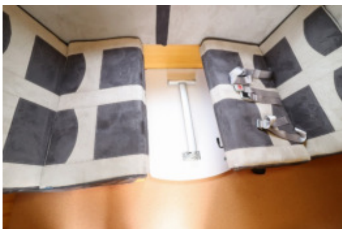
外したテーブルは座席の間に置けます。