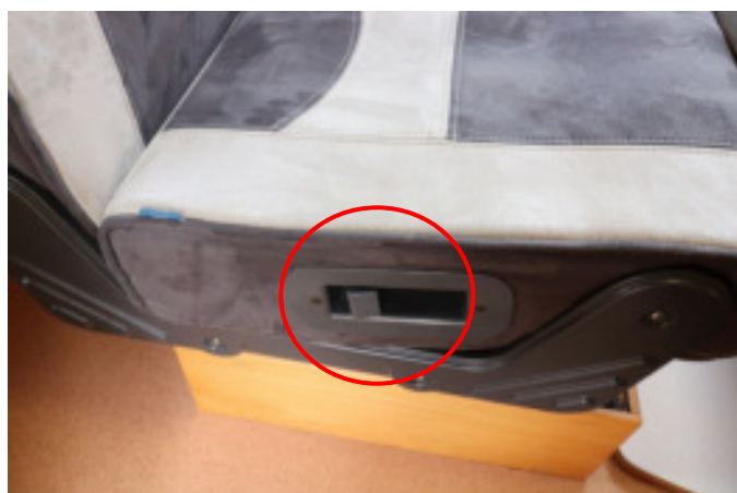
レバーを引いて座席を起こします。